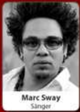
Marc Sway Sänger