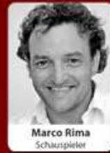
Marco Rima Schauspieler