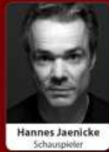
Hannes Jaenicke Schauspieler