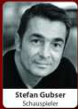
Stefan Gubser Schauspieler