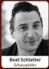
Beat Schlatter Schauspieler